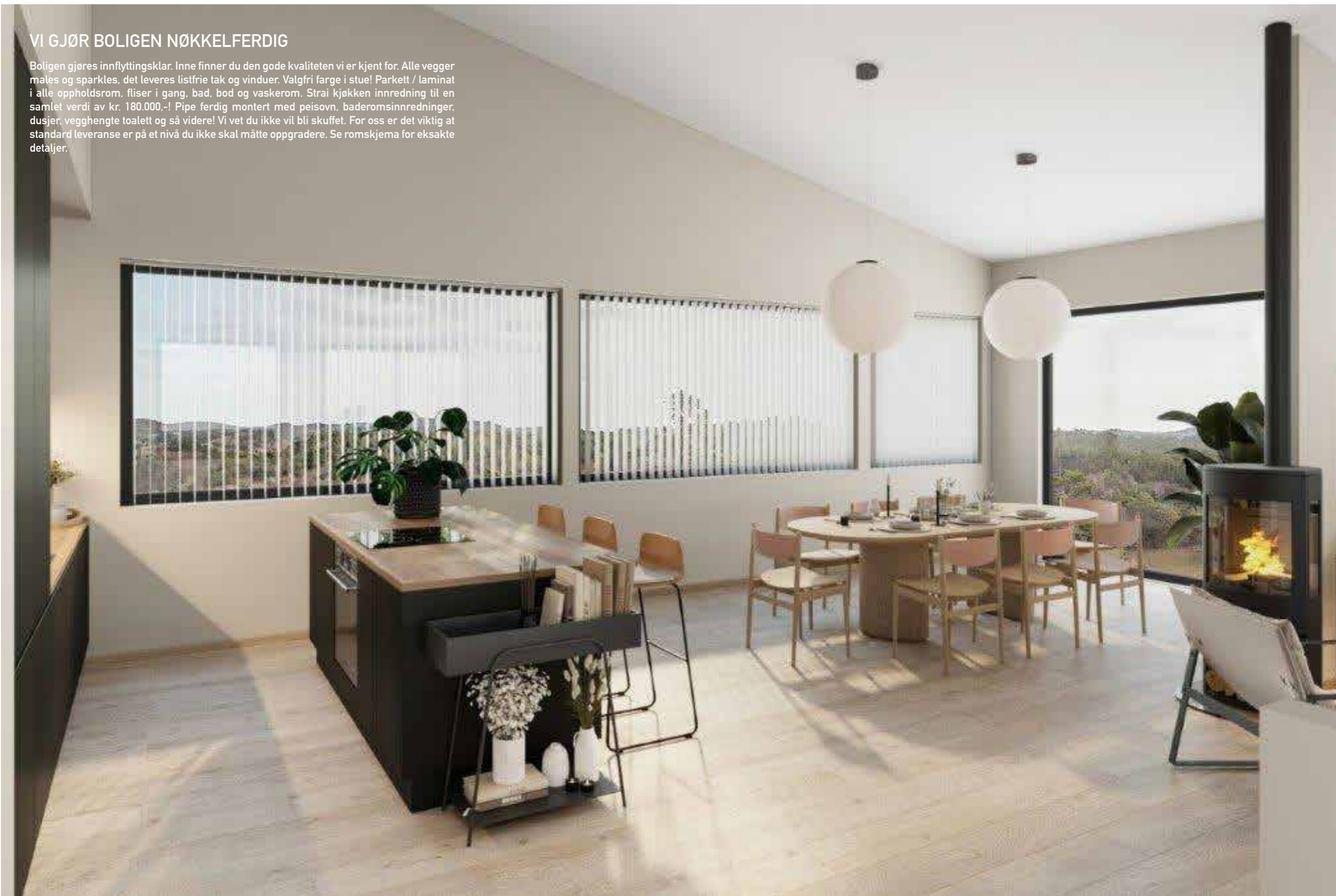
Illustrasjon av stue/kjøkken. Legg merke til at det er høyt under taket.

Boligen gjøres innflyttingsklar. Inne finner du den gode kvaliteten vi er kjent for. Alle vegger males og sparkles, det leveres listfrie tak og vinduer. Valgfri farge i stue! Parkett / laminat i alle oppholdsrom, fliser i gang, bad, bod og vaskerom. Strai kjøkken innredning til en samlet verdi av kr. 180.000,-! Pipe ferdig montert med peisovn, baderomsinnredninger, dusjer, vegghegte toalett og så videre! Vi vet du ikke vil bli skuffet. For oss er det viktig at standard leveranse er på et nivå du ikke skal måtte oppgradere. Se romskjema for eksakte detaljer.