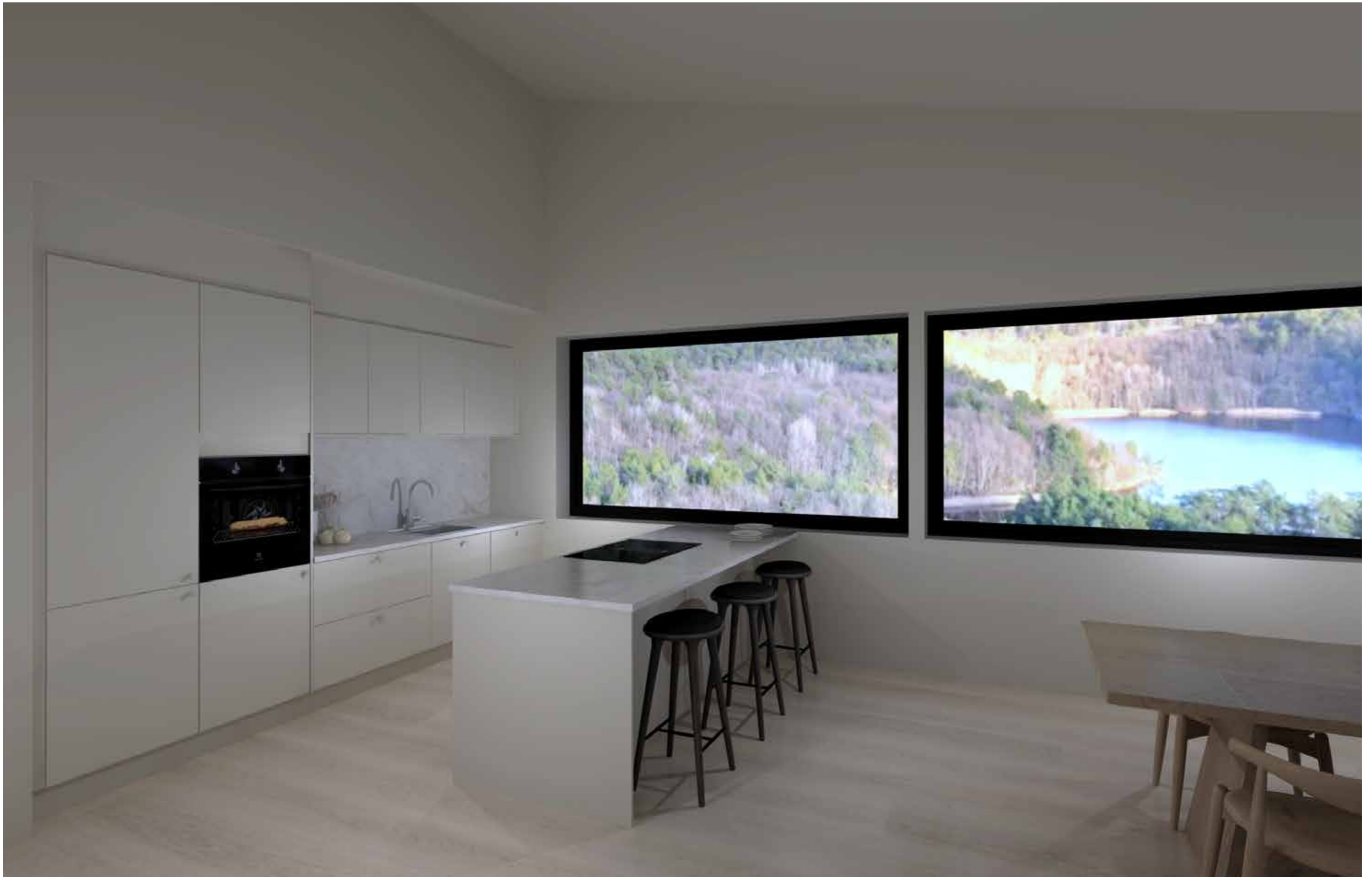
Kjøkkentegning Trollbærveien 45-47